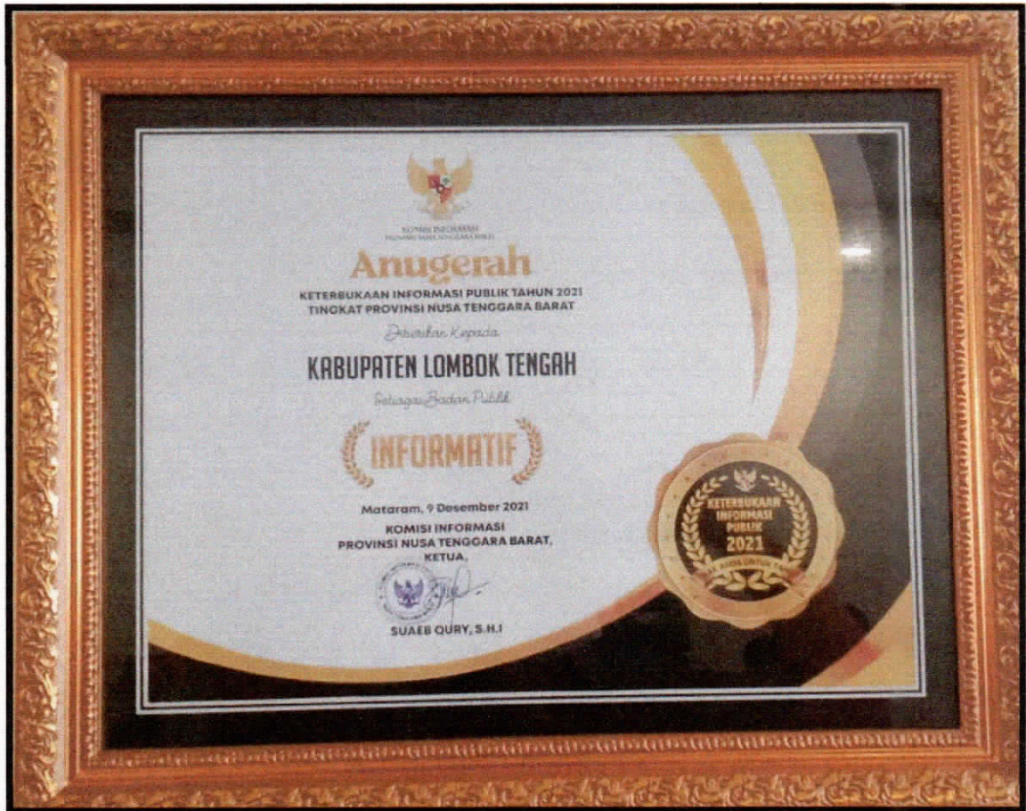
Penghargaan dari Komisi Informasi Provinsi NTB Sebagai Badan Publik Informatif Tahun 2021