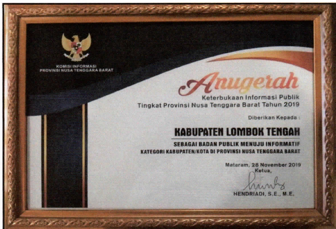
Penghargaan dari Komisi Informasi Provinsi NTB Sebagai Badan Publik Menuju Informatif Katagori Kabupaten/Kota tahun 2019