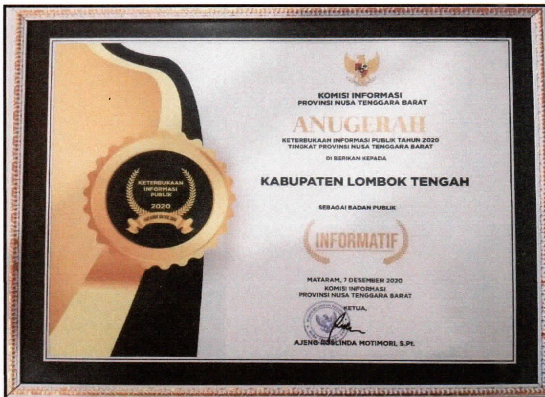
Penghargaan dari Komisi Informasi Provinsi NTB Sebagai Badan Publik Informatif Tahun 2020