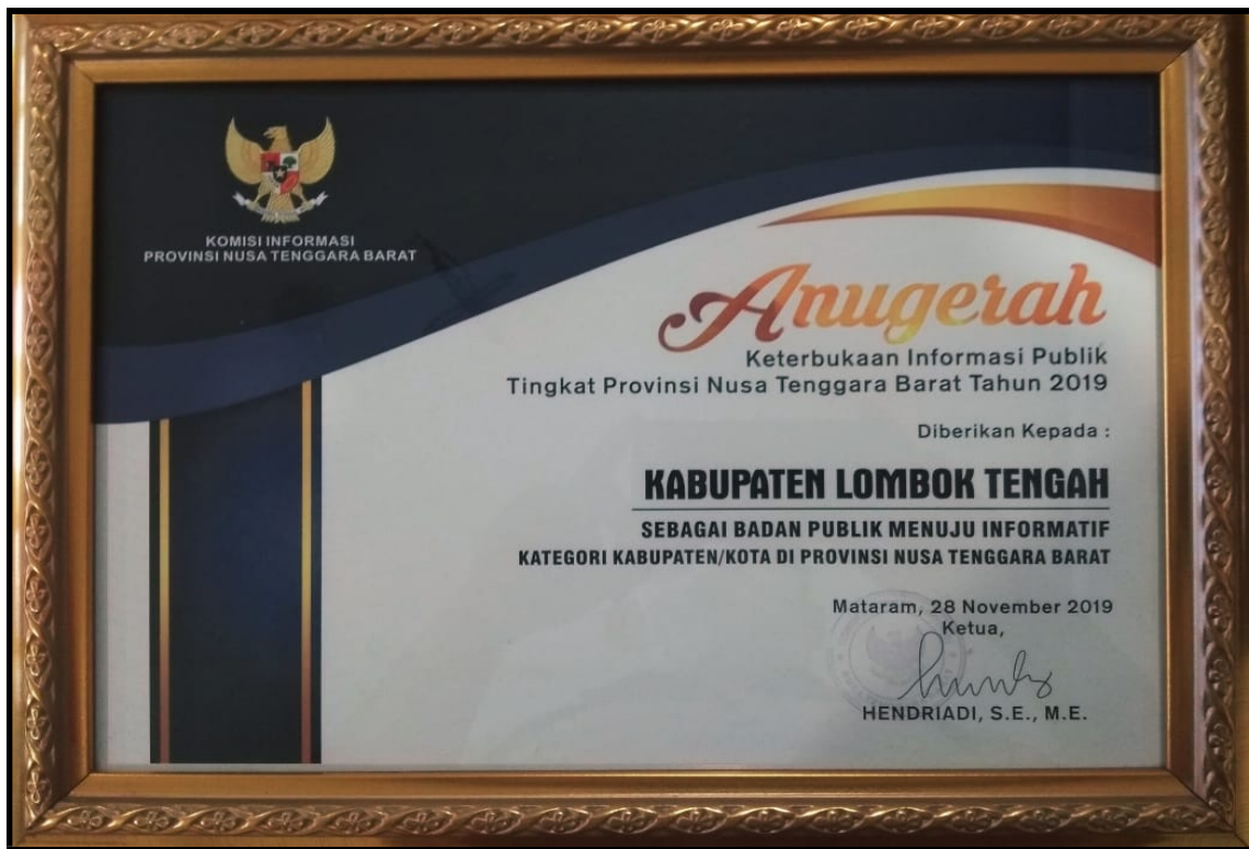
Penghargaan dari Komisi Informasi Provinsi NTB Sebagai Badan Publik Menuju Informatif Katagori Kabupaten/Kota tahun 2019