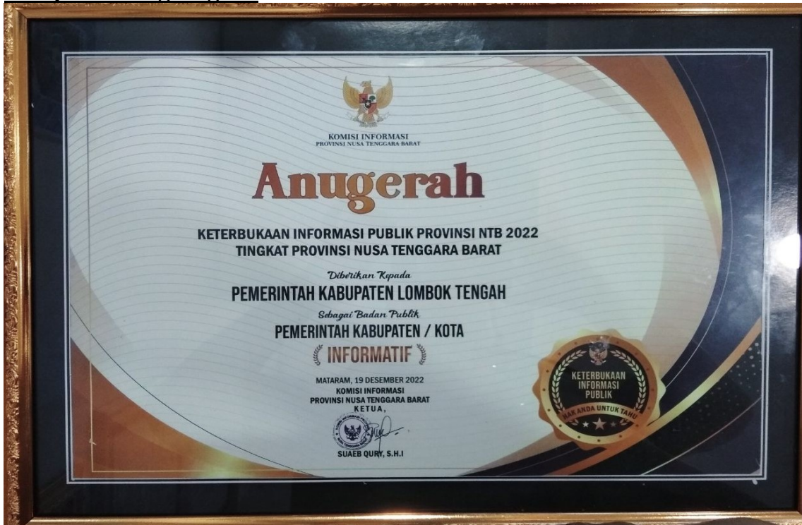
Penghargaan dari Komisi Informasi Provinsi NTB Sebagai Badan Publik Pemerintah Kabupaten/Kota Informatif Tahun 2022