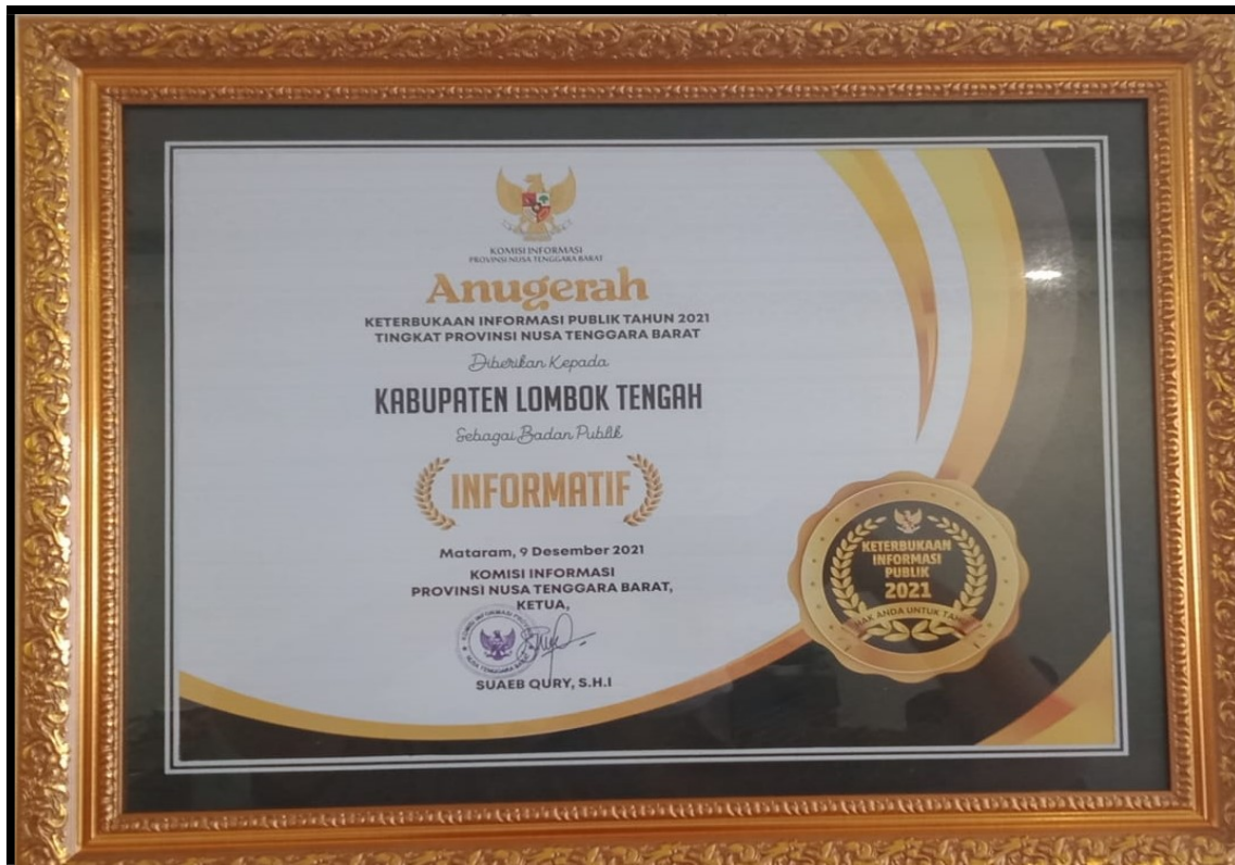
Penghargaan dari Komisi Informasi Provinsi NTB Sebagai Badan Publik Informatif Tahun 2021