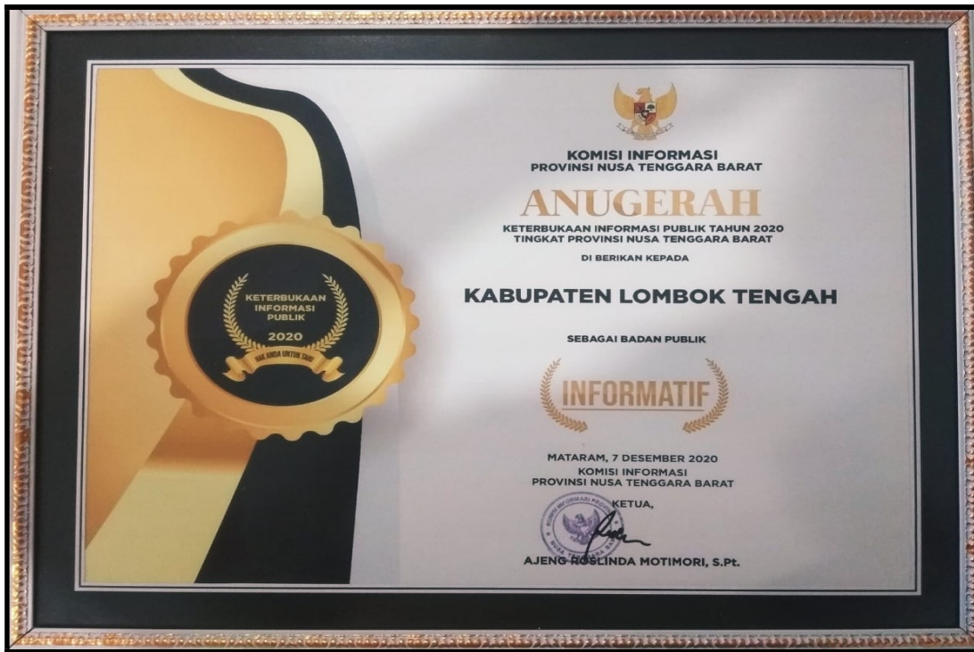
Penghargaan dari Komisi Informasi Provinsi NTB Sebagai Badan Publik Informatif Tahun 2020