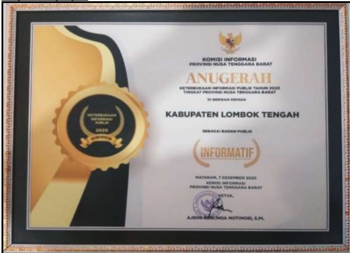
Penghargaan dari Komisi Informasi Provinsi NTB Sebagai Badan Publik Informatif Tahun 2020