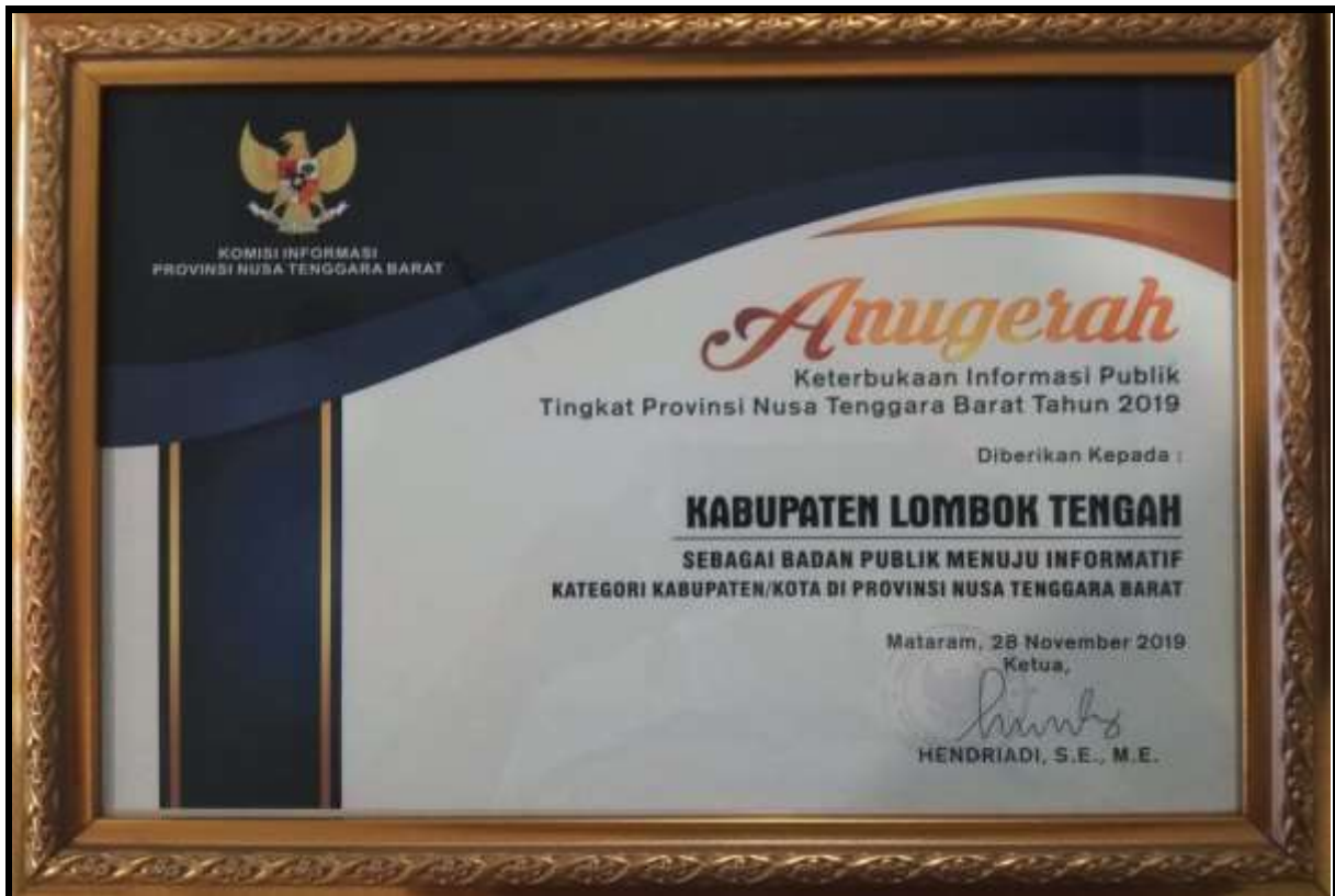
Penghargaan dari Komisi Informasi Provinsi NTB Sebagai Badan Publik Menuju Informatif Katagori Kabupaten/Kota tahun 2019