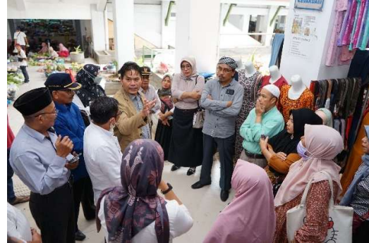
Gambar 2.6 Monitoring & evaluasi (Monev) Bidang Perekonomian

Realisasi capaian kinerja kegiatan Pengawasan Penyelenggaraan Pemerintahan untuk Tahun 2023 adalah sebesar 6 dokumen dari target sebesar 6 dokumen atau 100%. Adapun realisasi Dokumen Hasil Pengawasan DPRD dengan rincian sebagai berikut :