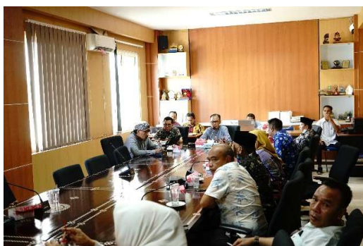
Gambar 2.3 Pembahasan KUA dan PPAS

Kegiatan Pembahasan Kebijakan Anggaran dimaksudkan untuk memfasilitasi kebijakan anggaran baik berupa Nota Kesepakatan maupun dokumen Pembahasan APBD.