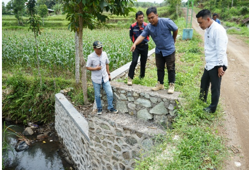
Gambar 2.5 Monitoring & evaluasi (Monev) Bidang Infrastruktur

Kegiatan pengawasan penyelenggaraan pemerintahan ini dimaksudkan untuk memfasilitasi salah satu tugas pokok dan fungsi DPRD selain fungsi budgeting dan fungsi legislasi. Pengawasan dilakukan oleh Komisi berdasarkan leading sektor masing-masing Komisi.