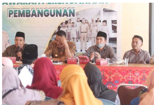
Gambar 2.9 Pelaksanaan Reses

Kegiatan Hearing/ dialog dan koordinasi dengan pejabat pemerintah daerah dan tokoh masyarakat/tokoh agama dimaksudkan untuk memfasilitasi kegiatan Pimpinan dan Anggota DPRD dalam rangka hearing atau dengar pendapat dengan Tokoh masyarakat/agama/adat. LSM serta organisasi kemasyarakatan lainnya terhadap permasalahan yang berkembang ditengah masyarakat di Kabupaten Lombok Tengah selama Tahun 2023.