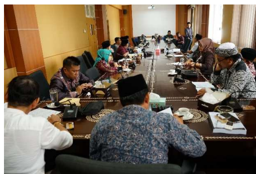
Gambar 2.4 Pembahasan APBD

Realisasi capaian kinerja kegiatan Pembahasan Kebijakan Anggaran adalah sebanyak 5 dokumen dari target 5 dokumen atau 100%. Adapun realisasi dokumen-dokumen Kebijakan Anggaran dengan rincian sebagai berikut :