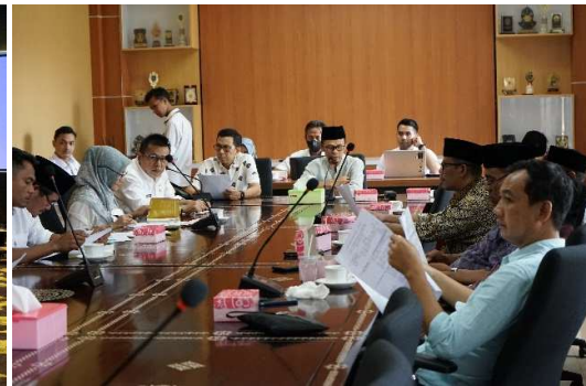
Gambar 2.8 Penyusunan Program Kerja DPRD

Realisasi capaian kinerja kegiatan Peningkatan Kapasitas DPRD untuk tahun 2023 adalah sebesar 18 dokumen dari target 19 dokumen atau 94,74%. Adapun realisasi Dokumen Pelaksanaan Peningkatan Kapasitas dengan rincian sebagai berikut :