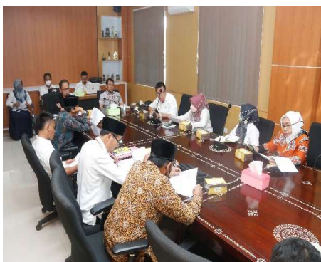
Gambar 2.11 Kegiatan Rapat Pimpinan DPRD

Kegiatan Fasilitasi Tugas DPRD ini dimaksudkan untuk memfasilitasi tugas-tugas DPRD dalam rangka melaksanakan tugas pokok dan fungsi DPRD.