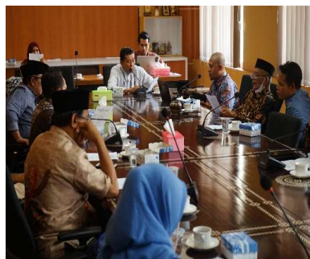
Gambar 2.12 Kegiatan Rapat Badan Musyawarah (Banmus)

Realisasi capaian kinerja kegiatan Fasilitasi Tugas DPRD untuk tahun 2023 adalah sebesar 31 dokumen dari target 31 dokumen atau 100%. Sedangkan Capaian kegiatan ini untuk tahun 2022 adalah sebesar 19 dokumen dari target 21 dokumen atau 90,48%.