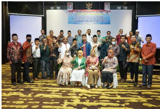
Gambar 2.7 Kegiatan Bimbingan Teknis Pimpinan dan Anggota DPRD