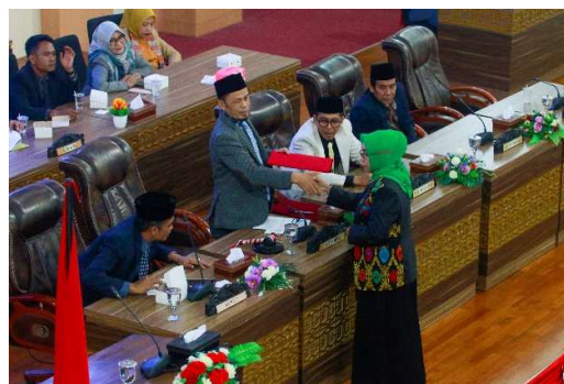
Gambar 2.2 Penetapan Peraturan Daerah