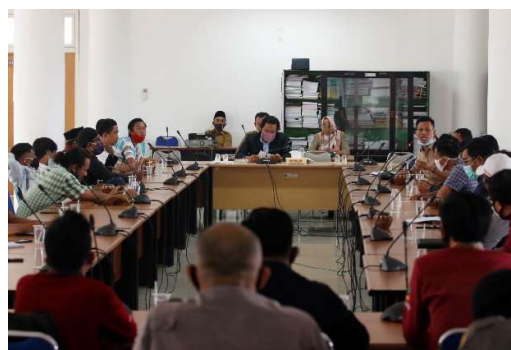
Gambar 2.10 Kegiatan Hearing/dengar pendapat

Realisasi capaian kinerja kegiatan Penyerapan dan Penghimpunan Aspirasi Masyarakat untuk tahun 2023 adalah sebesar 29 dokumen dari target 47 dokumen atau 61,70 %. Sedangkan Capaian kegiatan ini untuk tahun 2022 adalah sebesar 30 dokumen dari target 31 dokumen atau 96,77%. Adapun realisasi Dokumen Aspirasi Masyarakat dengan rincian sebagai berikut: