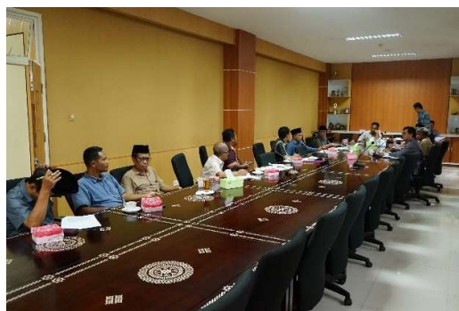
Gambar 2.1 Pembahasan Rancangan Peraturan Daerah

Kegiatan Pembentukan Peraturan Daerah dan Peraturan DPRD dimaksudkan untuk memfasilitasi rapat-rapat pembahasan Rancangan Peraturan Daerah (Ranperda) yang dilaksanakan oleh Panitia Khusus DPRD atau alat kelengkapan DPRD lainnya selama tahun 2023. baik berupa Ranperda Inisiatif DPRD maupun Ranperda Usul Pemerintah.