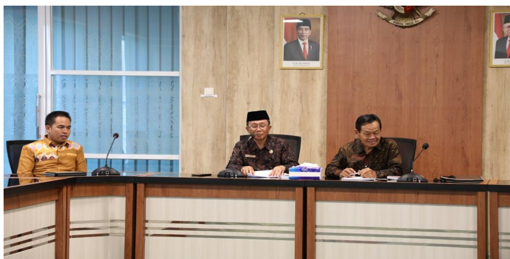
Foto : Kepala Dinas Komunikasi dan Informatika dan Wakil Ketua KI