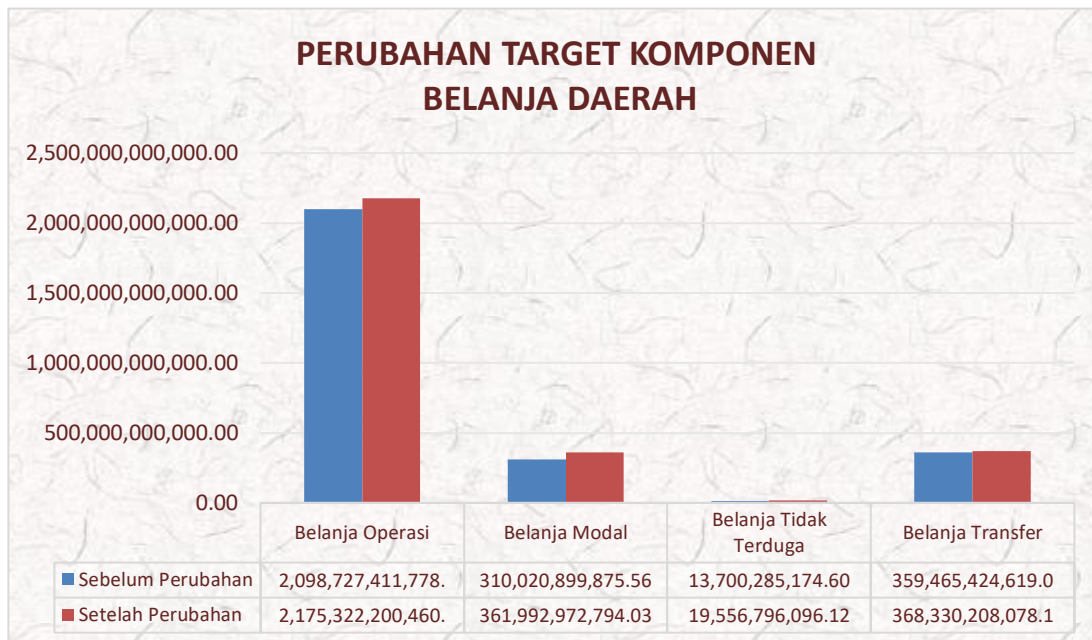
Grafik 5 : Perubahan Alokasi Pagu Anggaran Masing-Masing Komponen Belanja Daerah pada Perubahan APBD Kabupaten Lombok Tengah Tahun Anggaran 2025