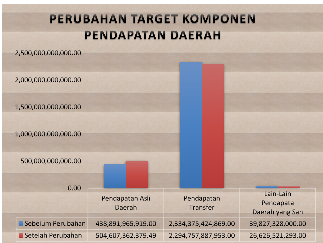
Grafik 2 : Perubahan Target Masing-Masing Komponen Pendapatan Daerah Pada Perubahan APBD Tahun Anggaran 2025

Perubahan target masing-masing komponen Pendapatan Daerah pada Rancangan Perubahan APBD Tahun Anggaran 2025 sebagaimana terlihat dalam grafik berikut ini :