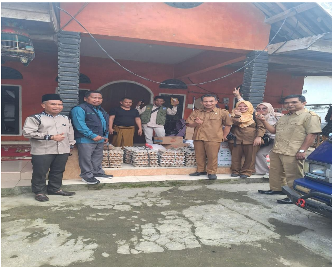
PENYERAHAN BANTUAN PERMAKINAN BAGI DISABILITAS, AT DAN LUT