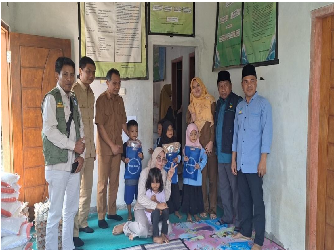
PENYERAHAN BANTUAN SANDANG PADA ANAK TERLANTAR