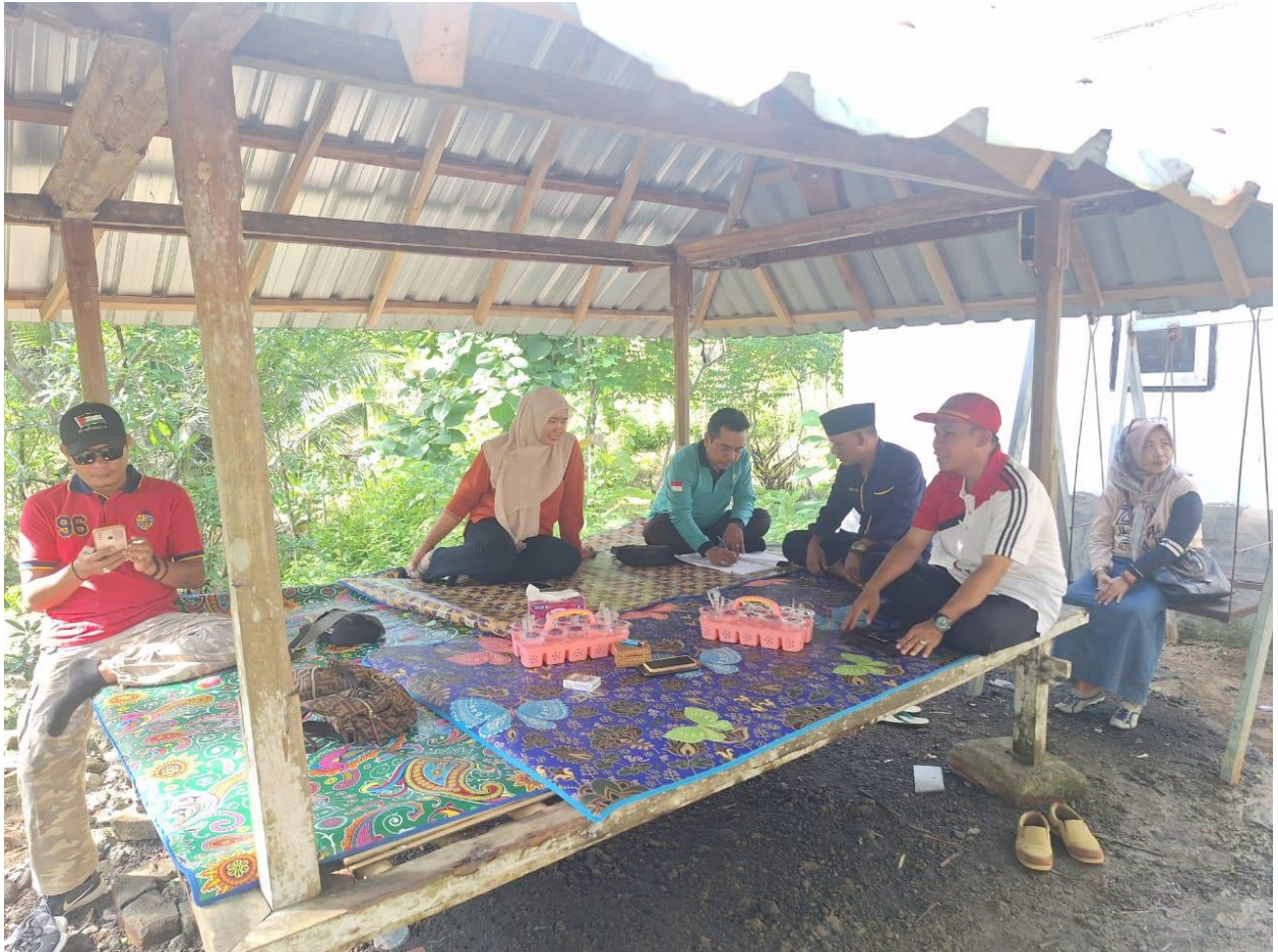
KEGIATAN VERVAL LKS CALON PENERIMA HIBAH