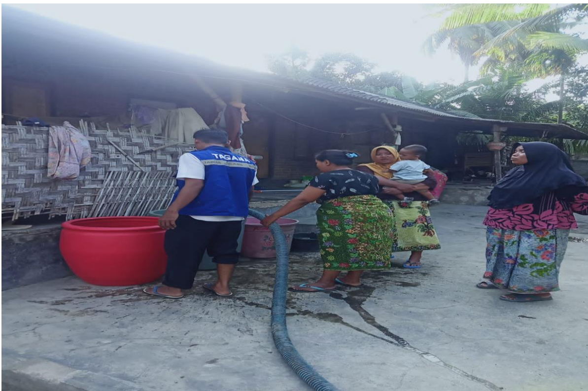
PENYALURAN AIR BERSIH BAGI WARGA MASYARAKAT YANG DILANDA KEKERINGAN