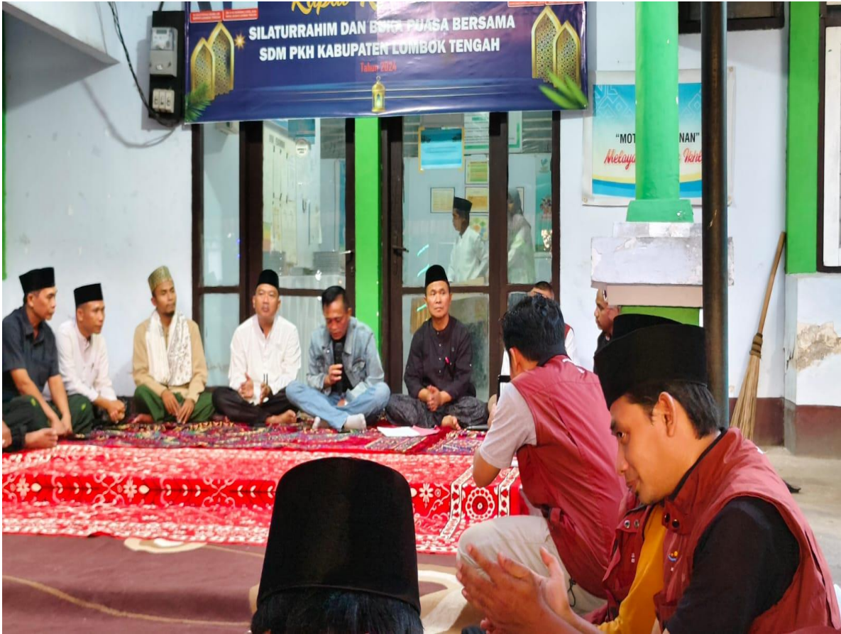
RAKOR PKH DENGAN BUPATI LOMBOK TENGAH