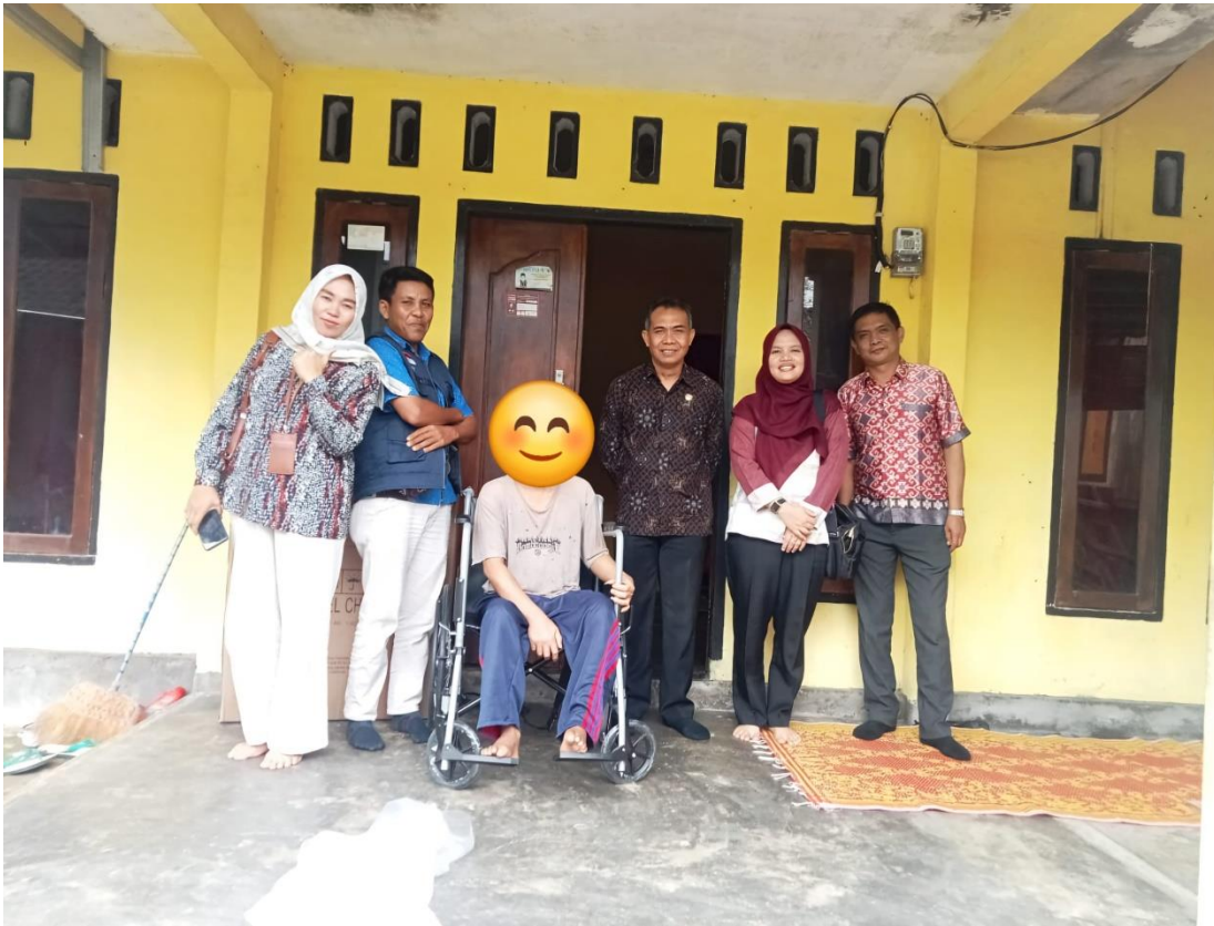
PENYERAHAN BANTUAN KURSI RODA PADA DISABILITAS