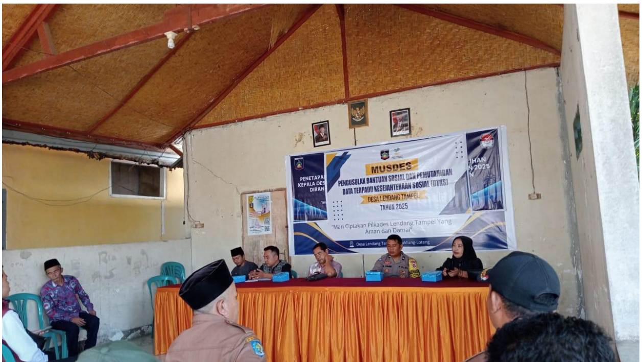
MUSDES MENGENAI DATA DTKS