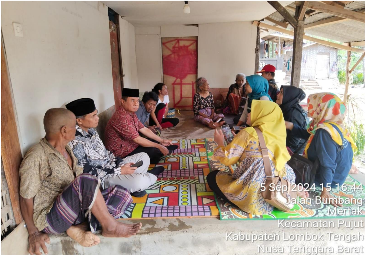
PENJANGKUAN KORBAN PERDAGANGAN ORANG