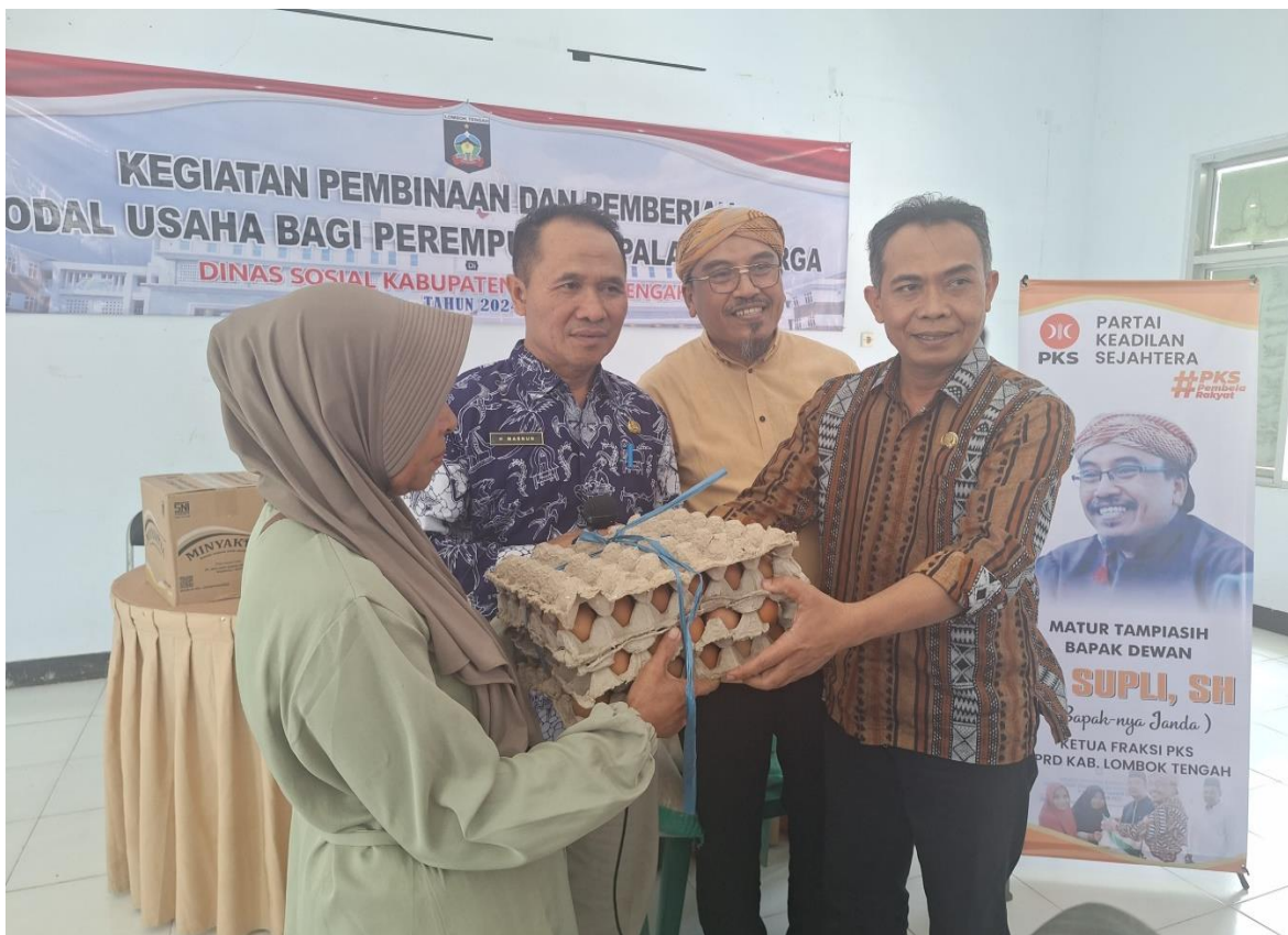
PENYERAHAN BANTUAN MODAL USAHA SEMBAKO BAGI WRSE