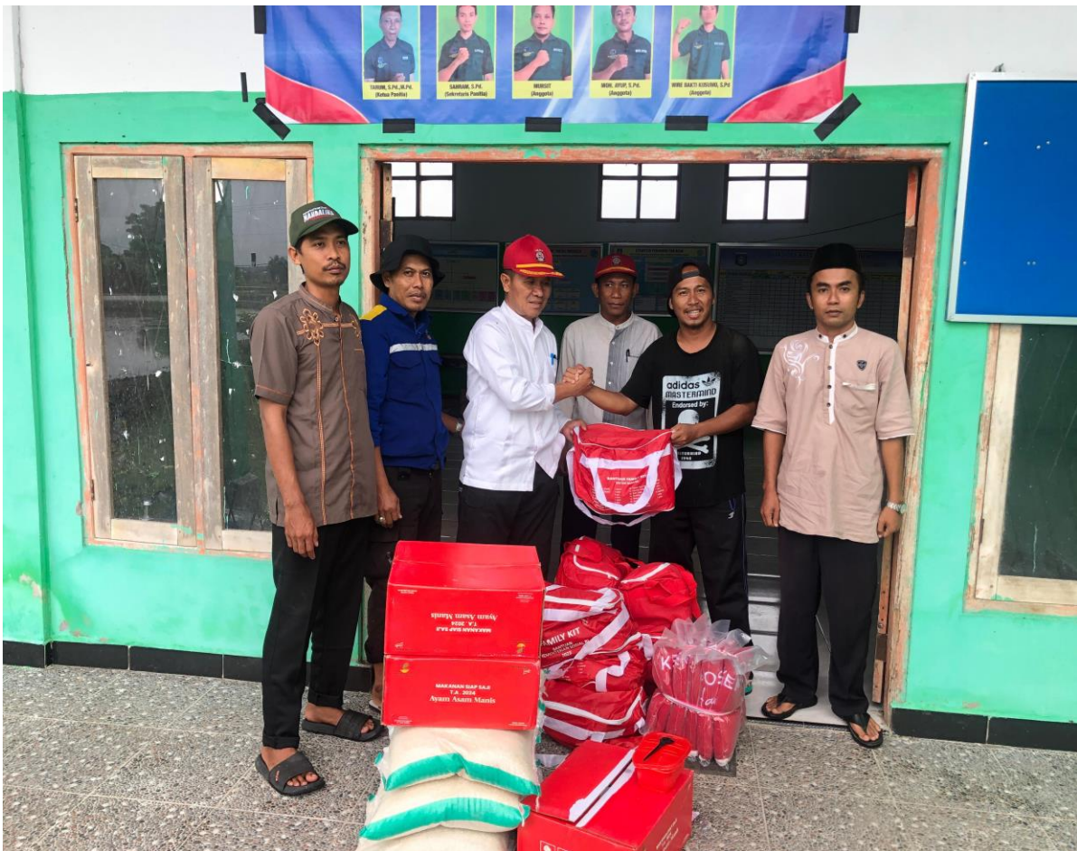
PEMBERIAN BANTUAN PADA KORBAN BENCANA