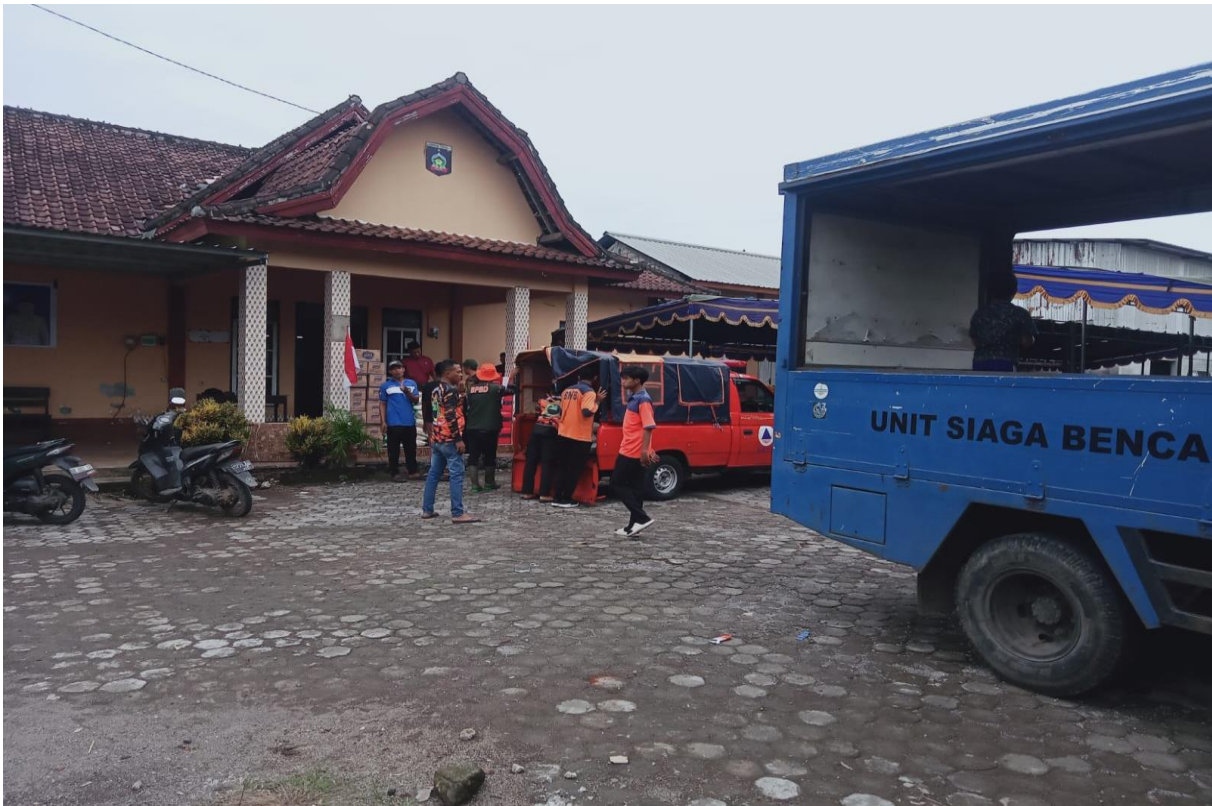
KOLABORASI DINSOS DENGAN BPPD TERKAIT PEMBERIAN BANTUAN PADA KORBAN BENCANA