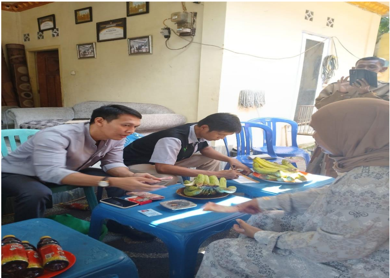
PENYERAHAN BLT DBH-CHT