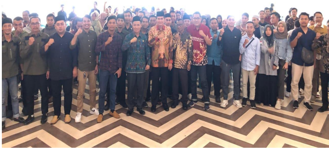
RAKOR PETUGAS PENDATA PPKS & PSKS DENGAN WABUP LOTENG