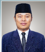
MURDANI, S.I.P., M.H